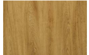
Turner Oak malt, Farb-Nr. 2031L