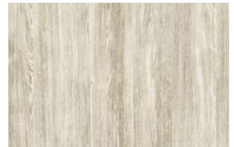
Sheffield Oak alpine, Farb-Nr. 2038L

Es stehen Ihnen drei moderne Oberflächen zur Verfügung, bei denen die sonst übliche „Holz-Pflege“ entfällt. So haben Sie lange Freude an der schönen Optik Ihrer Fenster.