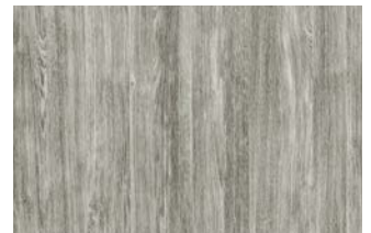
Sheffield Oak concrete, Farb-Nr. 2039L

Es stehen Ihnen drei moderne Oberflächen zur Verfügung, bei denen die sonst übliche „Holz-Pflege“ entfällt. So haben Sie lange Freude an der schönen Optik Ihrer Fenster.